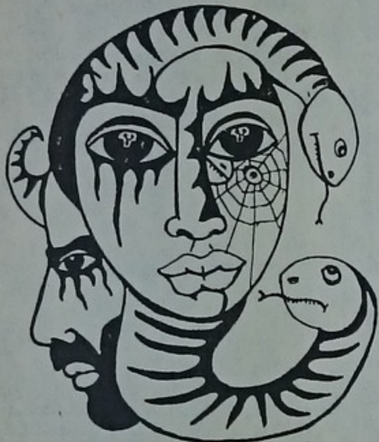
Sz.M. '83 TATA

Doja egy szép napon elhatározta, hogy otthagyja felhőpalotáját és lemegy népe közé. A nap sugarából ru-